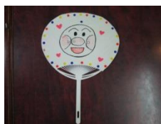
【オリジナルうちわ】