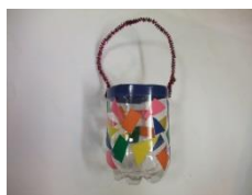
【ペットボトルのシャワー】