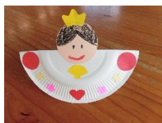
【ひな人形のシーソー】