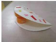
【紙皿カスターネット】