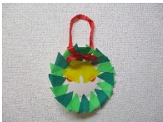
【クリスマスリース】