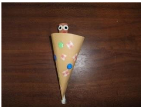
【かくれんぼうみのむし】

【手作りおもちゃの日】 1日(水) 15日(水) ★みんなで作ろう！ ※手作りおもちゃの日に材料を準備していますので、一緒に作りましょう！