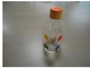
【どんぐりマラカス】

★秋の全国火災予防運動 11/9～11/15 標語「火の用心 ことばを形に 習慣に」