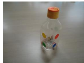
【どんぐりマラカス】