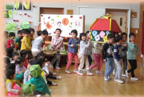
11/27 地域の方のご協力を頂き、収穫祭を行いました。