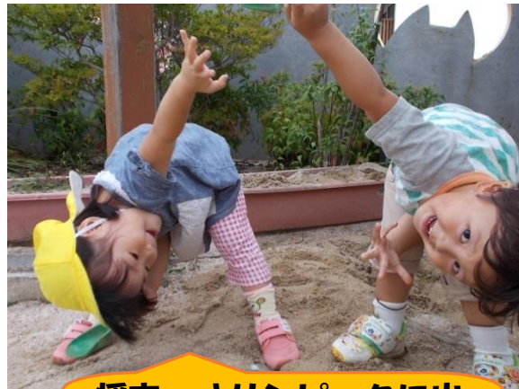
将来、オリンピックに出られるかな？