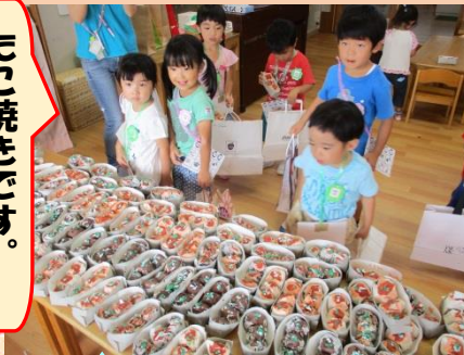
夏祭り(年少・年中組)の様子