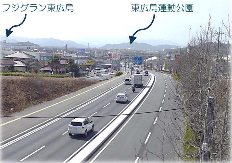
フジグラン東広島