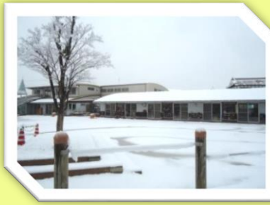
1月30日(金) 園庭の雪景色