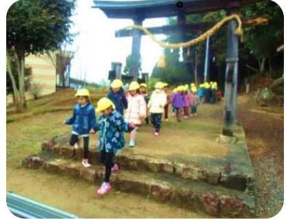
上戸神社へお散歩中(年長組)

今年からR375御園宇バイパス が4車線になり歩道もかなり広くな りました。中央分離帯ができたこと により交通の流れが変わり、横断す る時間がかかるなど注意が必要で 子ども達も散歩で通るため交通ル ルを守って安全に歩きます。散歩中 地域の方から手を振って頂くこと あり、子ども達は大変喜んでいま す。ありがとうございます。